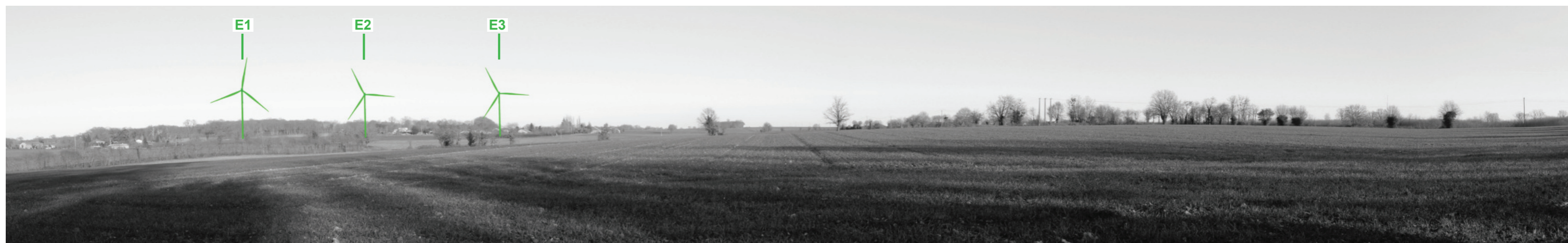
Vue panoramique noir et blanc avec esquisse du projet (angle de vue 120°)

Coordonnées Lambert II étendu : 412727 / 2139513,4 Date et heure de la prise de vue : 14/02/2019 à 18:40 Focale : 52 mm, équivalent 24 x 36 Azimut vue réaliste : 68° Angle visuel du parc : 19,6° Eolienne la plus proche : E1, à 1650 m