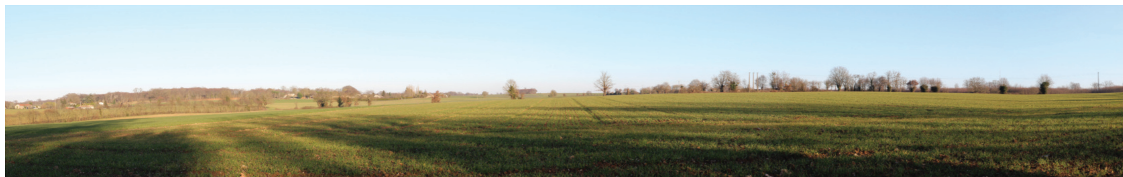
Vue panoramique de l'état initial (angle de vue 120°)